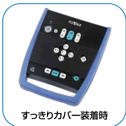
すっきりカバー装着時